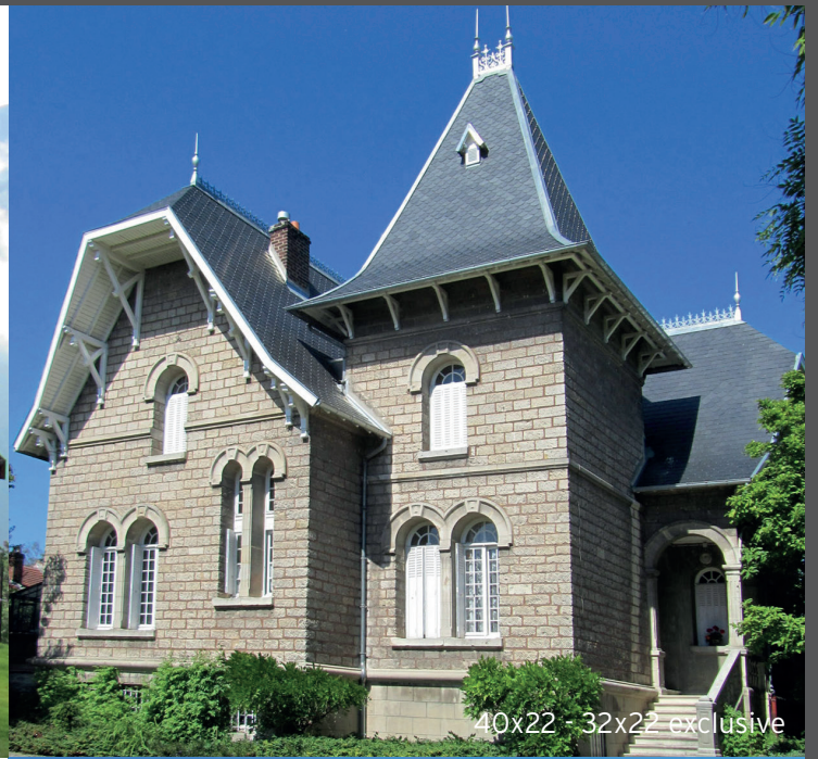
40x22 - 32x22 exclusive